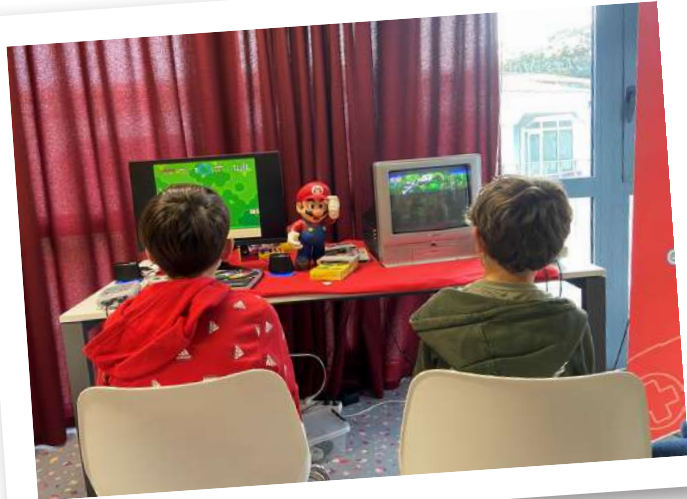
Après-midi « jeux vidéo » animée par Appuyezsurunbouton.

Fin de l'année 2023 à la Médiathèque entre sciences, Halloween, numérique et Afrique. Un programme varié !