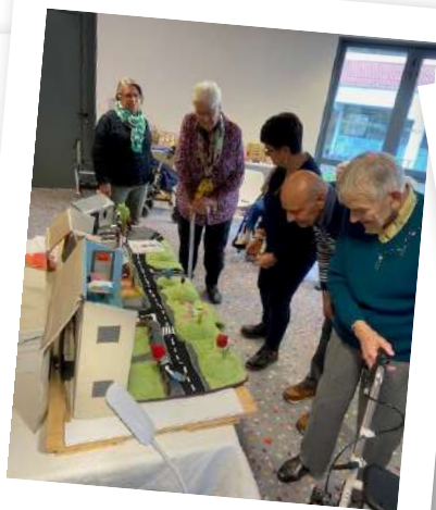
Visite des résidents de l'Ehpad.