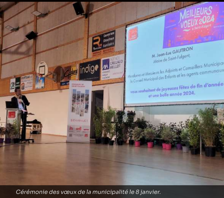
Cérémonie des vœux de la municipalité le 8 janvier.