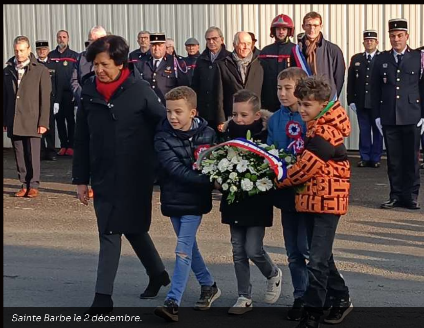
Sainte Barbe le 2 décembre.