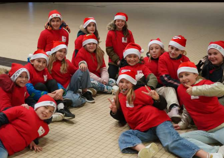
Les enfants du CME prêts pour la fête de Noël le 15 décembre.