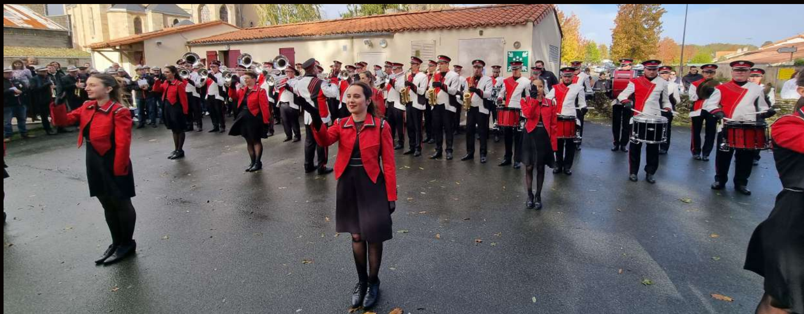
75 ans du Réveil Fulgentais le 4 novembre.