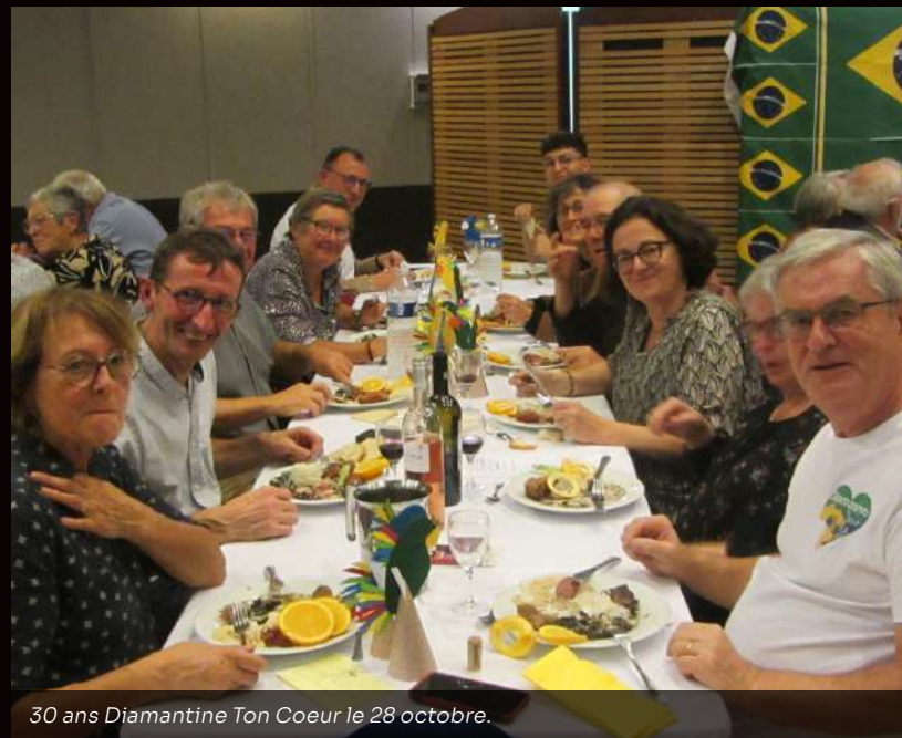
30 ans Diamantine Ton Coeur le 28 octobre.