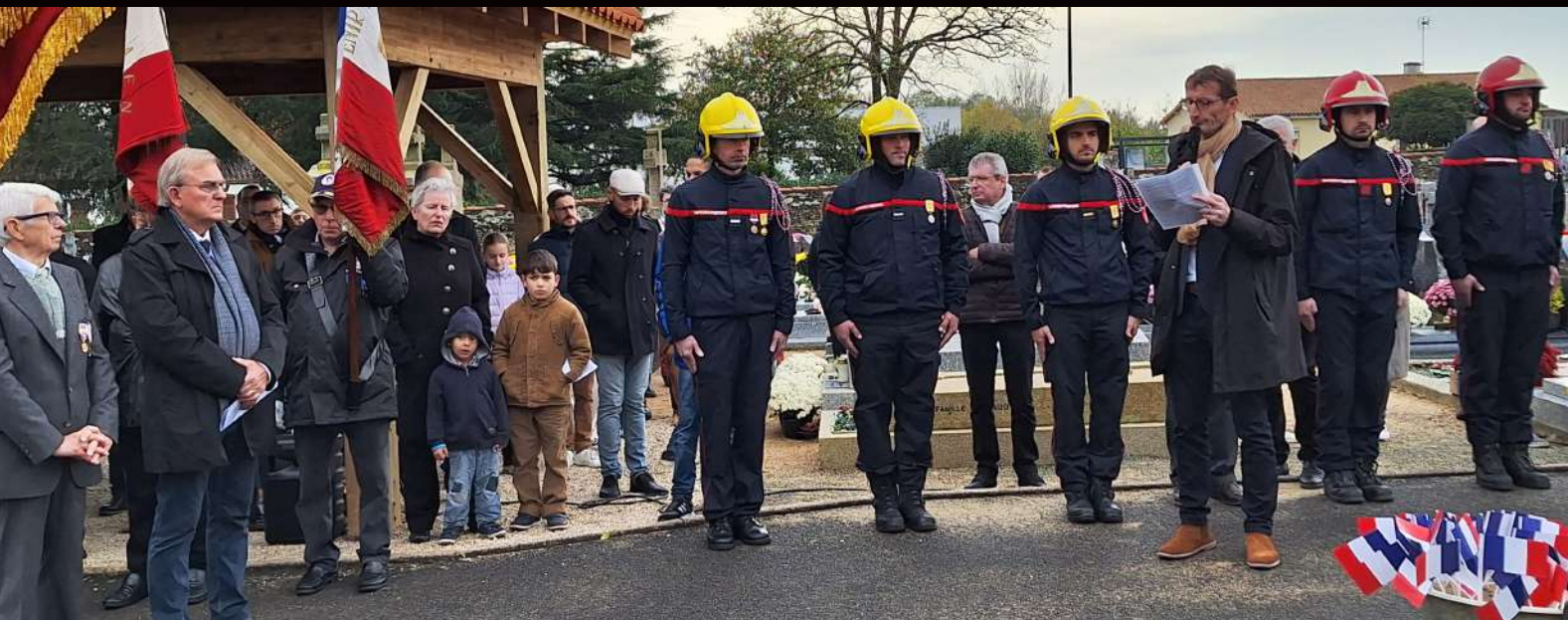
Commémoration du 11 novembre.