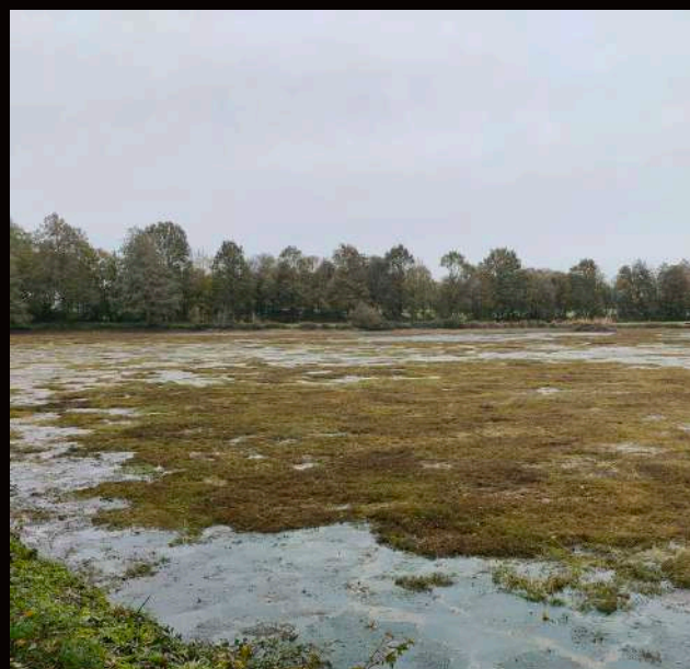
Vidange de l'Étang des Renaudières en novembre.