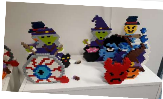
Après-midi de construction de Lego animé par Brickevent.