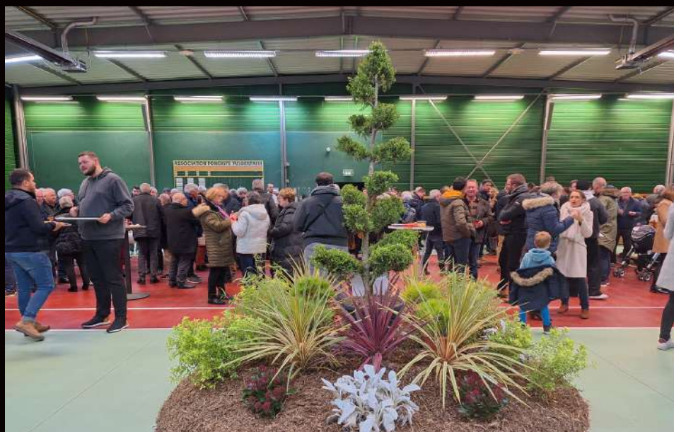
Cérémonie des vœux le 8 janvier : décoration réalisée par les agents communaux.