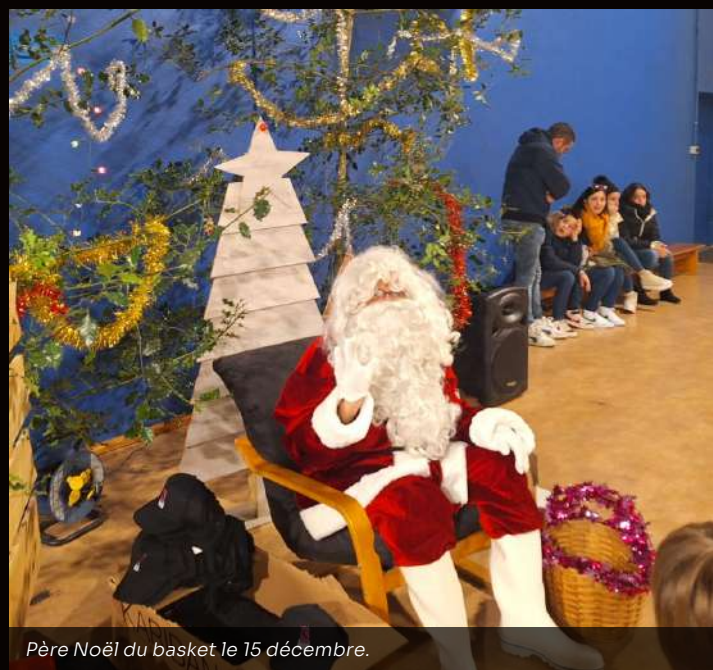
Père Noël du basket le 15 décembre.